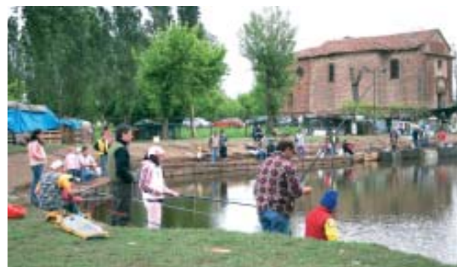
La gara di pesca sulle rive del laghetto di Casatico

E grande è stata l'affluenza anche agli altri eventi: la rassegna cinematografica, l'esibizione di bmx e breakdance, i tornei sportivi. E la festa è proseguita ancora tutto Giugno, per allietare anche l'inizio dell'estate a Siziano.