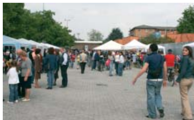
Giovani in attesa del concerto del 1° Maggio

Come da tradizione, anche quest'anno il Maggio Sizianese ha rappresentato un'occasione di festa e di aggregazione per l'intera comunità. Coinvolti, insieme al Comune, associazioni culturali e sociali, società sportive, operatori professionali. Un ricco calendario di proposte di ogni tipo e per tutti i gusti: stand alimentari, raduni, mostre.