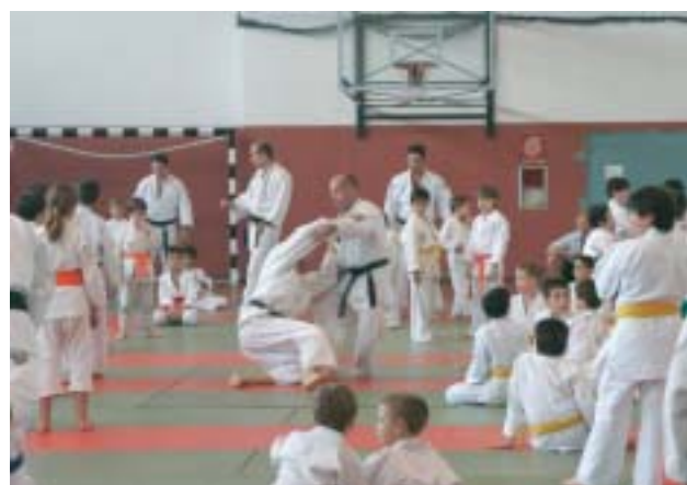
Alcune fasi del trofeo Laus di judo