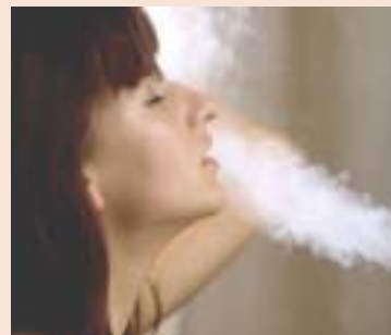
Il 13 maggio 2009 alle ore 21, in sala consiliare, si terrà la presentazione della convenzione con le Terme di Rivanazzano.