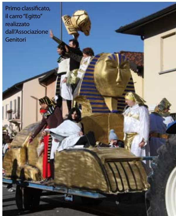
Primo classificato, il carro "Egitto" realizzato dall'Associazione Genitori

Sabato 20 febbraio la tradizionale sfilata dei carri tra le affollatissime vie del centro, piene di bambini, musica e colori