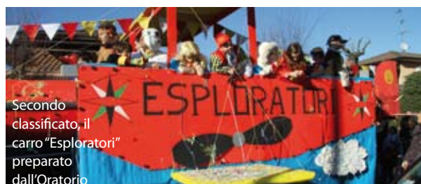
Secondo classificato, il carro "Esploratori" preparato dall'Oratorio