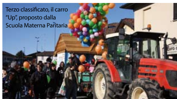
Terzo classificato, il carro "Up", proposto dalla Scuola Materna Paritaria