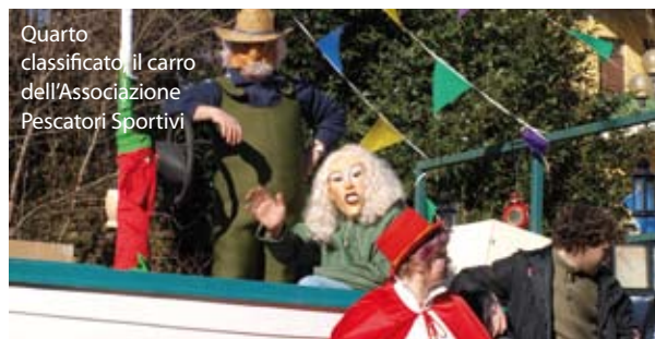
Quarto classificato, il carro dell'Associazione Pescatori Sportivi