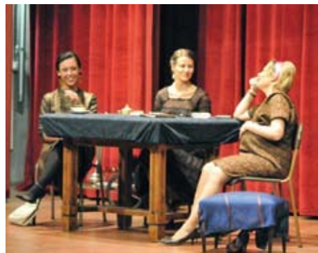
Immagini scattate durante alcuni spettacoli di precedenti edizioni della rassegna: da sinistra, "La cena dei cretini"; "Arsenico e vecchi merletti"; "Due partite"

F esteggia i dieci anni la nostra rassegna di teatro amatoriale, «Un progetto nato in modo sperimentale e via via cresciuto grazie allo splendido lavoro della Compagnia Filodrammatica G. Mazzufferi e al sostegno dell'Amministrazione Comunale, che ha fortemente