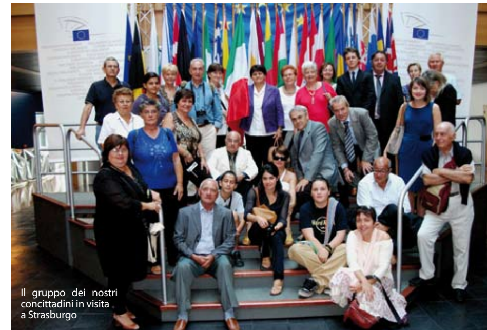
Il gruppo dei nostri concittadini in visita a Strasburgo

Il mattino successivo visita al Parlamento Europeo: una grande struttura moderna che ostenta la ricercatezza del particolare, del dettaglio, tutto comunque all'insegna del buon gusto. Grande uso di vetrate, strutture metalliche a vista, una bellissima scalinata in marmo di Carrara: un doppio elicoidale che ricalca il progetto del Sangallo della discesa al pozzo di San Patrizio a Orvieto. Una guida ci accompagna per tutto il palazzo, con gran dovizia di particolari poi, alla fine, entriamo nel Parlamento. Ci viene consegnata una piantina con la quale riusciamo a individuare i posti occupati dai rappresentanti italiani. Con un po' di immaginazione possiamo vedere una seduta plenaria dove uomini con lingue, etnie e culture diverse concorrono a un progetto comune. Per un paio di mezzogiornate abbiamo anche gironzolato per Strasburgo ammirando le sue opere architettoniche che hanno segnato le tappe storiche: le chiese a difesa della città, l'imponente cattedrale, il quartiere tedesco, la Petite France, e soprattutto le caratteristiche costruzioni a reticolato. Ciò che ha colpito di più la mia fantasia è stato il famoso orologio astrono-