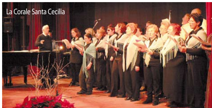
La Corale Santa Cecilia

Dal 2 dicembre una serie di eventi con il patrocinio del Comune accompagna verso la notte più magica dell'anno