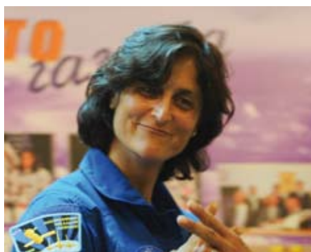
Dall'alto, un'immagine della Stazione Spaziale Internazionale e, nell'ordine, gli astronauti Joe Acaba, Akihiko Hoshide, Sunita Williams, con i quali si sono collegati gli studenti dell'Istituto Cairoli di Pavia

re attività educative con il coinvolgimento degli studenti dei vari istituti che desiderino fare questo tipo di esperienza.