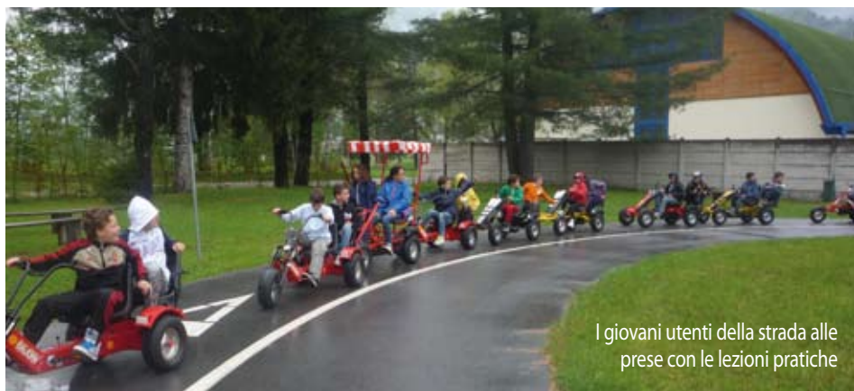
I giovani utenti della strada alle prese con le lezioni pratiche

Il progetto, promosso dal Comando di Polizia Locale in collaborazione con le insegnanti, intende offrire ai bambini della scuola Primaria di Primo Grado gli strumenti per sviluppare una conoscenza corretta delle norme che regolano lo spazio stradale nel rispetto di sé e degli altri