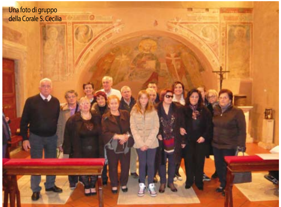
Una foto di gruppo della Corale S. Cecilia

La mattina successiva, passando per il portone centrale di S. Pietro, siamo stati