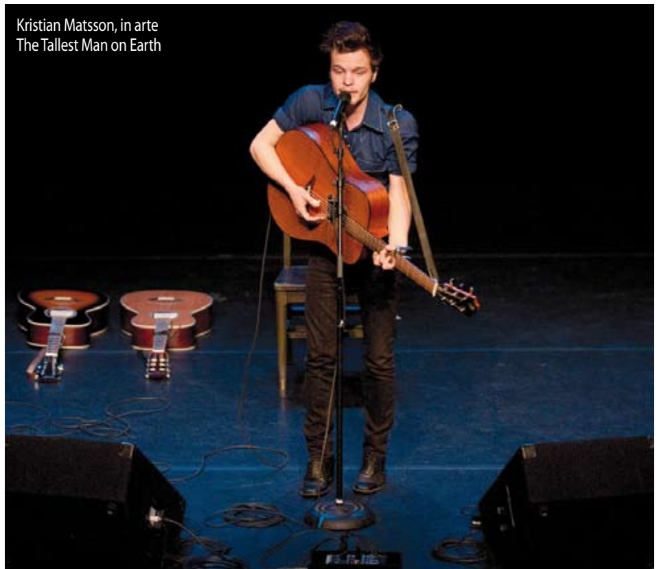
Kristian Matsson, in arte The Tallest Man on Earth

In circolazione dal 2008, ha saputo con-