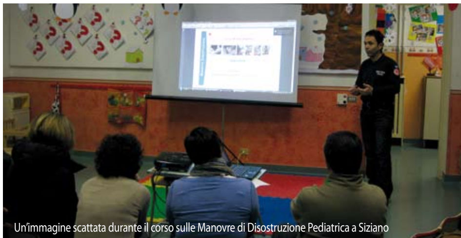
Un'immagine scattata durante il corso sulle Manovre di Disostruzione Pediatrica a Siziano

T ra le varie attività svolte dal Gruppo di Siziano della Croce Rossa Italiana non ci sono solo corsi per il reclutamento e la formazione di nuovi volontari. Gli istruttori del gruppo sono infatti impegnati in diverse iniziative, che vanno dai corsi di Primo Soccorso alla popolazione a quelli di Primo Soccorso aziendale (DLgs 81/08). Ultimi in ordine di attivazione, ma non certo di importanza, sono i corsi di Manovre di Disostruzione Pediatriche (MDPED) rivolti a genitori, nonni e professionisti del settore dell'infanzia. Al motto di "Chi salva un bambino salva il mondo intero", questo progetto, nato da un'idea del Dott. Squicciarini, medico e volontario di Croce Rossa, si è rapidamente esteso in tutta Italia e ha coinvolto i vari gruppi di Croce Rossa. Il corso prevede una lezione teorico-pratica incentrata sulle manovre da effettuare in caso di ostruzione delle vie aeree in un bambino. Sappiamo tutti come la cronaca spesso riporti notizie di bambini soffocati da oggetti ingoiati accidentalmente. Questi drammatici episodi possono essere affrontati conoscendo una serie di semplici manovre da effettuare sul bambino affinché espella l'oggetto che gli impedisce di respirare. Le lezioni di questo corso sono proprio mirate ad acquisire tali manovre. Quest'anno, grazie alla collaborazione delle insegnanti dell'Asilo Infantile - Materna Paritaria di Siziano (che nel