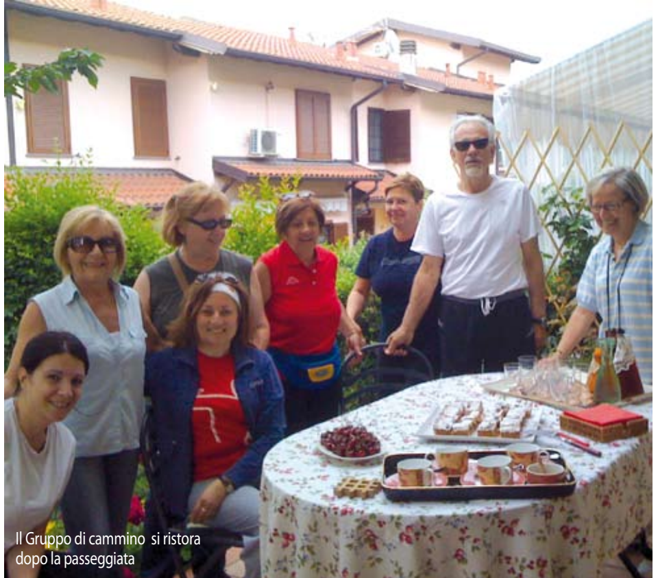
Il Gruppo di cammino si ristora dopo la passeggiata