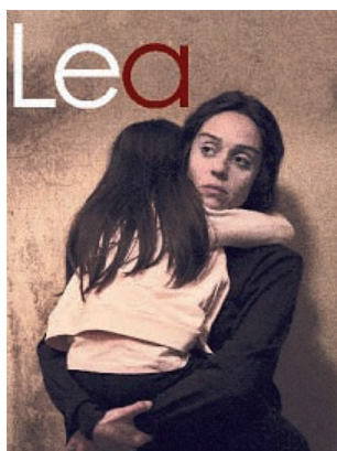
La locandina del film

Dal 1996, ogni anno il 21 marzo in una città diversa, viene letto un elenco di circa novecento nomi di vittime innocenti. Ci sono vedove, figli senza padri, madri e fratelli. Ci sono i parenti delle vittime conosciute, quelle il cui nome richiama subito un'emozione forte. E ci sono i familiari delle vittime il cui nome dice poco o nulla. Per questo motivo è un dovere civile ricordarli tutti. Nel giorno della Memoria voluto da Libera, alle 21 presso la Biblioteca Comunale con ingresso gratuito, verrà pro-