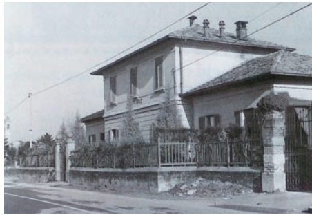
L'Asilo ieri (sopra) e oggi (a destra)

Oggi la identifichiamo come Scuola dell'Infanzia Paritaria, ma tale denominazione è dovuta agli adeguamenti dell'ultima riforma scolastica ed è solo relativamente recente rispetto alla precedente che la indicava come la Scuola Materna affidata alle Suore. La più comune è però quella rimasta nel cuore e nei ricordi dei Sizianesi: Asilo Infantile o più semplicemente l'Asilo. L'edificio, nel corso dei suoi quasi cento anni, non ha vissuto in solitudine, ma si è continuamente rinnovato; è stato ampliato, trasformato, ristrutturato, riadattato alle nuove esigenze dei suoi frequentatori e gode tuttora di buona salute, accogliendo oggi come allora, circa cento bambini in età pre-scolare. L'Asilo Infantile sorse a Siziano per volontà di alcuni fondatori e benefattori che, in pieno