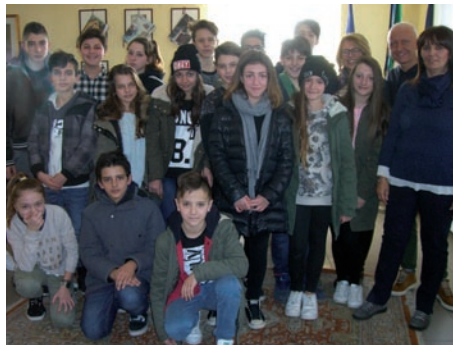
Il Consiglio Comunale dei Ragazzi per l'anno scolastico 2015/2016

Gli obiettivi sono molteplici e tutti di carattere educativo: far comprendere il concetto di tempo cronologico attraverso l'evoluzione di giochi e giocattoli; saper esprimere le proprie preferenze ludiche; conoscere e sperimentare giochi del passato /in disuso; scoprire differenze e analogie tra i giochi del passato e quelli attuali; intuire la necessità del rispetto delle regole ; saper attendere il proprio turno nelle attività che richiedono tale modalità; scoprire il piacere della condivisione durante l'attività ludica; promuovere lo sviluppo della dimensione logica attraverso il gioco; conoscere e confrontare il gioco in culture diverse dalla propria ; stimolare l'uso della creatività alla ricerca di nuove vie d'uscita di fronte alle difficoltà; promuovere l' espressività ; educare alla dimensione temporale: il gioco ha un inizio e una fine, collocato all'interno del contesto quotidiano con degli spazi definiti. Il progetto prevede la realizzazione di do-