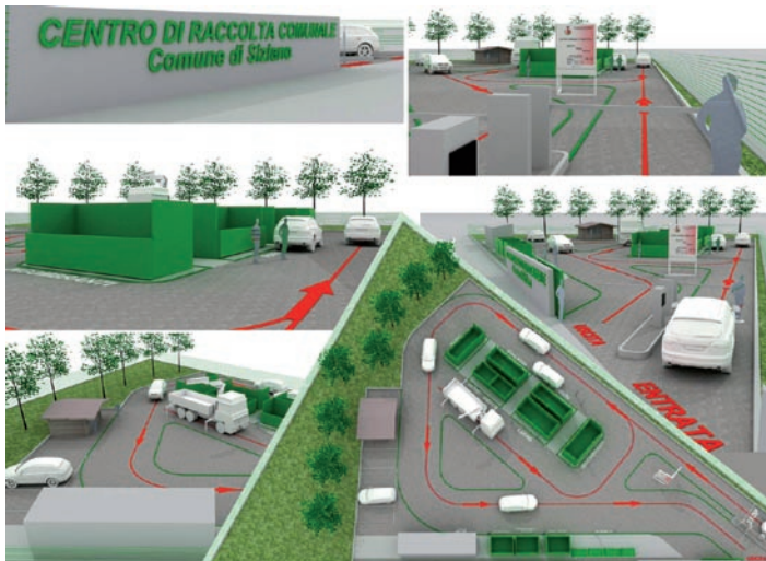
Sopra, il rendering del progetto per il Centro di Raccolta

Il recente appalto, assegnato alla Ditta Pizzamiglio, introduce ulteriori servizi che intendono facilitare i cittadini nel corretto smaltimento di ogni tipo di scarto