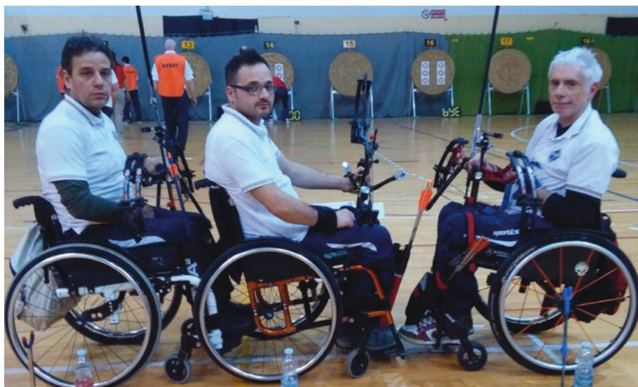
Nella foto, i tre nuovi campioni nazionali