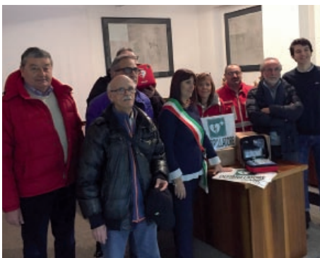
La consegna dei DAE donati dal Comune

Come previsto dal Decreto Balduzzi (Gazzetta Ufficiale Serie Generale n.169 del 20 luglio 2013), dallo scorso gennaio tutte le società sportive, anche dilettantistiche, devono disporre di un defibrillatore semiautomatico (DAE o AED) e di personale adeguatamente formato durante le partite e gli allenamenti. Per aiutare le società sportive ad adeguarsi alla normativa, il nostro Comune sostenuto un importante investimento in nome della sicurezza, donando i defibrillatori per quattro strutture comunali (Palazzetto,