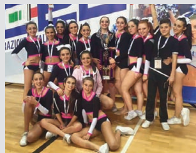
Le Angels Cheer Team