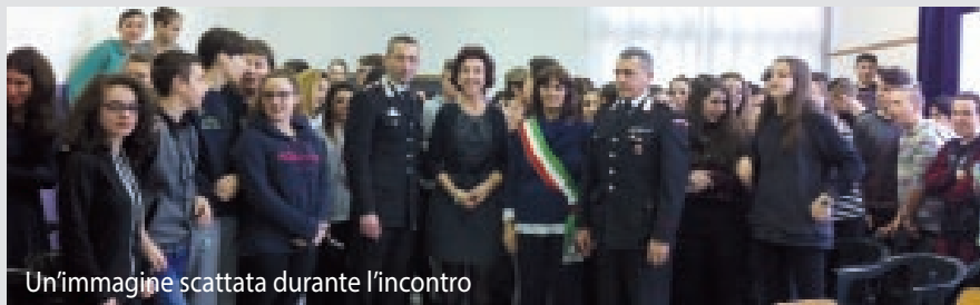
Un'immagine scattata durante l'incontro

Instaurare un dialogo tra le istituzioni e i ragazzi, stabilire una vicinanza e far sentire loro che possono rivolgersi alle istituzioni in qualsiasi momento ne sentissero la necessità.