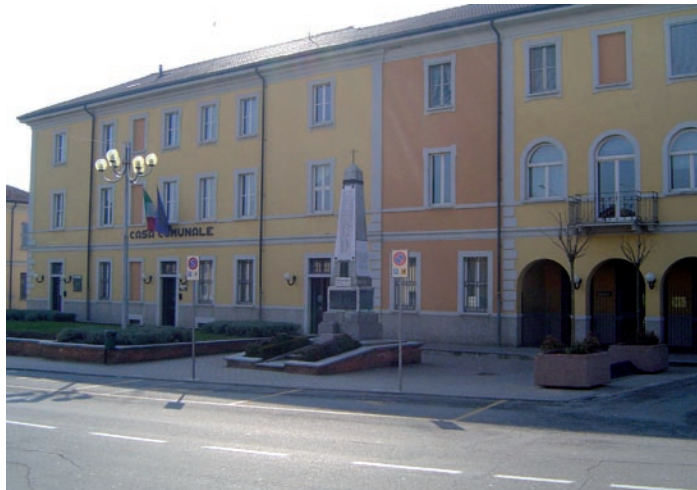
La Casa Comunale dopo i lavori di ristrutturazione

«Dopo anni di grande difficoltà per far fronte alle manutenzioni del patrimonio esistente, finalmente possiamo cominciare l'anno con una serie di lavori già appaltati, frutto di una possibilità aperta lo scorso dicembre che ci ha consentito di impegnare una piccola parte dell'avanzo 2014 e indire una gara pubblica per il valore di 200.000 euro finalizzata alla sistemazione delle strade - spiega il Sindaco, Donatella Pumo -. Questa cifra, cui vanno aggiunti altri 80.000 frutto di una convenzione urbanistica, ci consentirà di asfaltare entro la primavera via Marconi, via XXV Aprile, via Moro, via D'Acquisto, via Fermi e, parzialmente, via F.lli Cervi, via De Filippo e via Casamatta . Anche le opere sulla rete idrica saranno ultimate entro la primavera e dopo l'estate la società provvederà alla riasfaltatura di tutte le strade interessate dai lavori». L'Amministrazione Comunale ha inoltre appaltato anche altri 30.000 euro per la riqua-