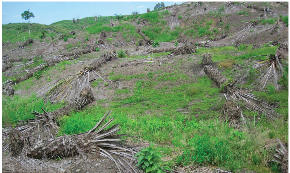
Dall'alto, un incendio appiccato a una foresta in Amazzonia e gli effetti della desertificazione

vanni Onore missionario italiano ci invia il messaggio: "...anche io alzo il naso in aria e fiuto, fiuto, fiuto, odore di fumo! Anche in Ecuador se fai una foto del satellite vedrai tanti fuochi e un pennacchio di fumo che si alza verso il cielo e che non è precisamente incenso gradito al Creatore ma fumo puzzolento per il dio denaro.