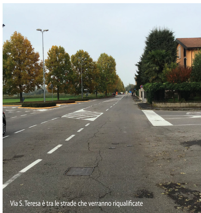
Via S. Teresa è tra le strade che verranno riqualificate